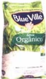
Blue Ville Arroz