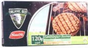
Hamburguesa Orgánica Congelada Friboi