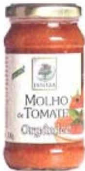
Salsa de Tomate Jatobá