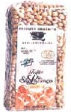
Porotos Agro Ecologic