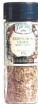
Especies Deshidratadas Fuchs