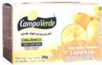
Tes para Relajar Campo Verde