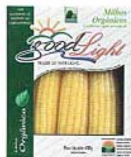
Choclo Orgánico Cocido en Vapor al Natural GOOD LIGHT