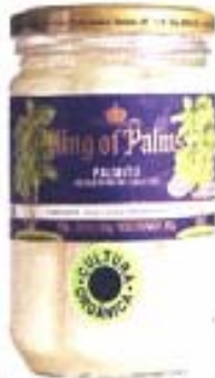
Palmitos King of Palms