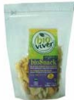
Mix de Frutas Orgánicas Secas y Castañas BIO VIVER