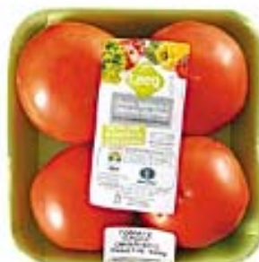
Tomate Caqui Orgánico TAEQ