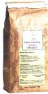
Harina de Mandioca Especial Orgánicos Cotrimaio