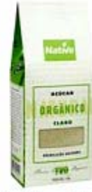
Native Azúcar Claro del Tipo Cristal